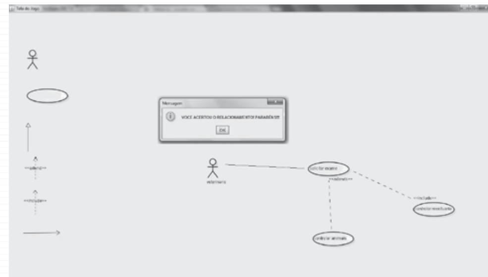
Figura 1 – UMLEARNING

componente ator e o caso de uso. Este relacionamento é notoriamente pertinente ao jogo, ou seja, para realizar tais relacionamentos, o aluno precisará entender o estudo de caso.