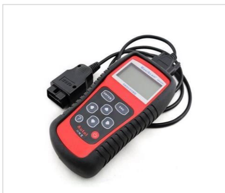
Figura 4 – Scanner automotivo