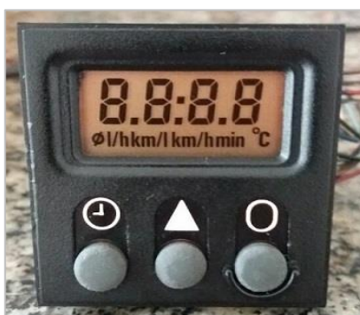
Figura 1 – Computador de Bordo do Monza

Segundo Delai (2013), sistema embarcado é a combinação de hardware e software em um único dispositivo com objetivos pré-definidos, ou seja, computadores de bordo são sistemas embarcados e funcionam por meio de sensores eletrônicos com a finalidade de fornecer recursos que auxiliem na dirigibilidade de automóveis, apresentando dados atualizados em tempo real conforme funcionamento do veículo.